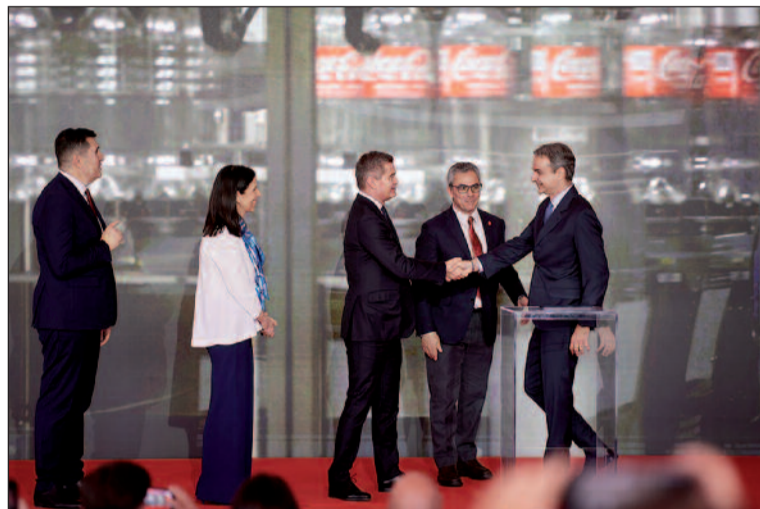
Ελλάδα που ευημερεί.

Ουσιαστικά η επένδυσή σας συνιστά ένα άλμα παραγωγικότητας. Μαζί με τον ιδιωτικό τομέα, με τις μεγάλες ελληνικές επιχειρήσεις, οικοδομούμε την Ελλάδα που παράγει και εξάγει, που εξελίσσεται παράλληλα με την εποχή, την